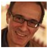
Evelino Pidò CONDUCTOR