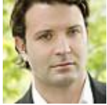
Charles Rice BARITONE