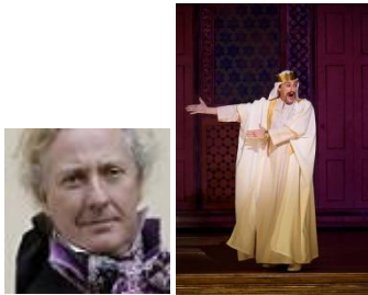
Christophe Mortagne TENOR