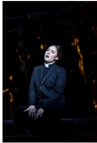
Sonya Yoncheva SOPRANO