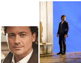
Vittorio Grigòlo TENOR